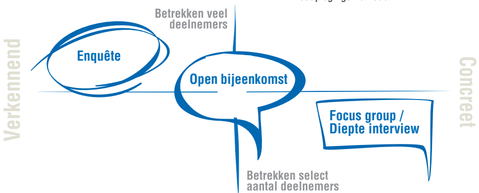
Figuur 4.2: Overzicht van verschillende raadplegingsmethoden

Als er een duidelijk beeld is van wat belangrijke thema's zijn voor de verschillende deelnemers, kan een enquête verspreid worden om concrete vragen te stellen over de thema's die voor de deelnemers belangrijk zijn. Dit is uiteraard slechts een voorbeeld, er zijn meerdere volgorden mogelijk om de verschillende methoden van raadpleging te gebruiken.